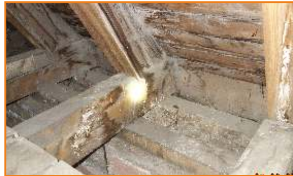
Nun ist das Dach kaputt, das Gebälk marode.

ORANIER24 steht zum einen für die Vision der gemeinsamen Zukunft, in die wir uns als Kirchengemeinde aufmachen: Wie können wir in Zukunft Gesellschaft in Biebrich mit unserem christlichen Auftrag gestalten?