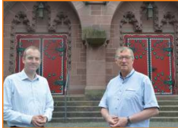
Wir freuen uns auf Ihre Spende! Herzlichen Dank!

Lassen Sie es uns gemeinsam mutig angehen! Wenn wir uns einsetzen für ORANIER24 , werden wir das Ziel erreichen!