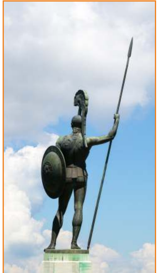
Achilles-Statue im Achilleion (Korfu) Das Achilleion ist ein Palast auf Korfu bei Gastouri, etwa sieben Kilometer südlich der Inselhauptstadt Korfu, den die österreichische Kaiserin Elisabeth (Sisi) in den Jahren 1890–1892 erbauen ließ. Benannt wurde der Palast nach Achilleus, den Sisi wegen seiner Kraft bewunderte.